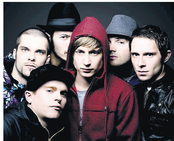
Die Liricas Anas gehören zu den innovativsten Kräften der Szene.

Liricas Anas: «Analectrica» (Eisbrand/Musikvertrieb) ist seit 6. März im Handel. Live: Sa, 21.3., Grabenhalle, 21 Uhr